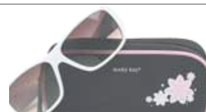
Очки с футляром