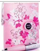
Блокнот с ручкой