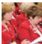
Шаг к Лидерству