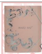
Папка для бумаг