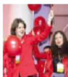
Участия в парадах